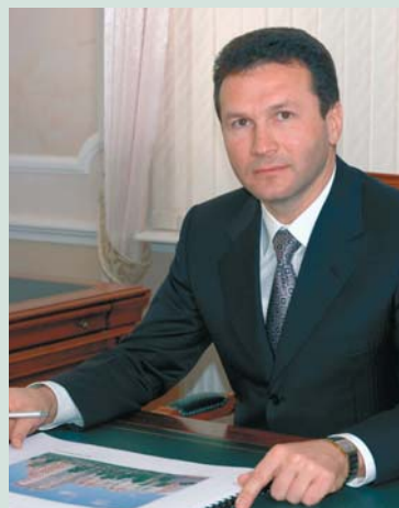
Н. И. Пасяда

Вице-губернатор по строительству, дорожному хозяйству, энергетическому комплексу и ЖКХ Ленинградской области