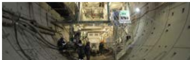
ОАО «Метрострой» ведет работы по строительству первого в Петербурге двухпутного тоннеля метро

Цель Партнерства – создать условия, благодаря которым объемы проектирования и строительства подземных сооружений постоянно увеличивались бы, а качество работ оставалось на высоте. Относительно узкая специализация саморегулируемой организации позволяет делать это наиболее эффективно. Только через призму профессиональной деятельности и общих задач можно поднимать авторитет добросовестных компаний, повышать качество работ и подготовки кадров, влиять на другие вопросы, связанные с повышением производительности труда, технической оснащенностью, ростом конкурентоспособности наших компаний.