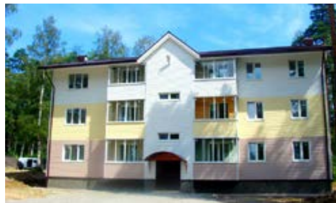
Строительство квартала ЖК «Сосновая горка» организацией-партнером СРО «СФЕРА-А» ООО НПКФ «ОРТИС»

Представители СРО НП «ЦОС «СФЕРА-А» входят в состав рабочих групп НОСТРОЙ, в том числе в группу, которая занимается вопросами, связанными с противодействием «коммерческим» СРО СЗФО, а также в группу по законотворчеству. СРО «СФЕРА-А» входит в состав Союза Строительных Объединений и Организаций г.Санкт-Петербурга, а также является членом ОМОР «Российский Союз Строителей».