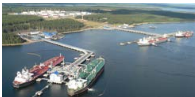
Портовые сооружения Балтийской трубопроводной системы. ОАО трест «Севзапморгидрострой»